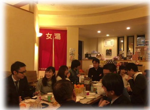
↑ 過去の写真。この時はなんと銭湯で行われました。